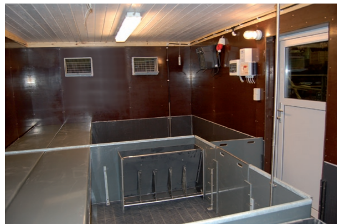
Alle installationer til el, vand og gyllesystem er færdiginstalleret i pavillonen fra fabrikken, og kan nemt tilsluttes de bestående installationer.