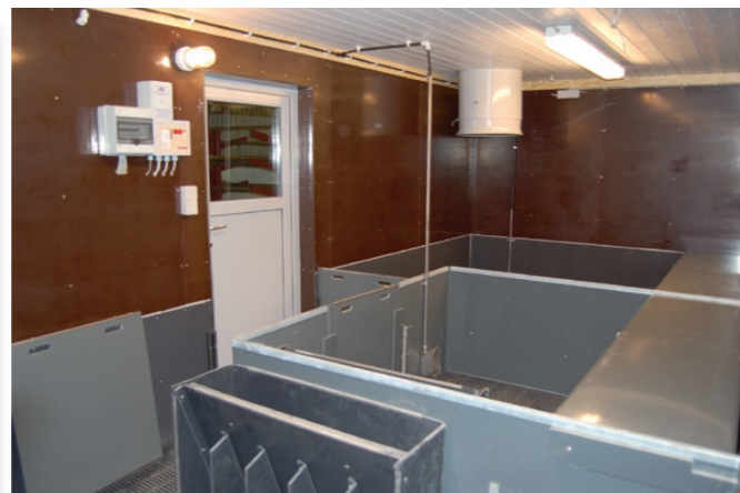
Pladsforholdene i og omkring boksene er fuldt ud på højde med en almindelig fravænningsstald, og giver meget nem adgang til at arbejde med grisene.