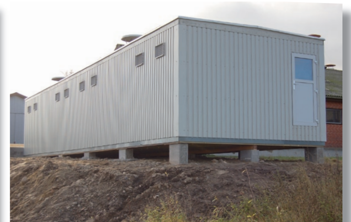
Pavillonen på plads, tilsluttet og produktionsklar.