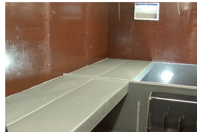
Danbox klimapavillonerne giver et godt og miljø for grisene. Alt inventaret er i rengøringsvenligt genbrugsplast, med varmelåg der sikrer nem adgang til grisene.