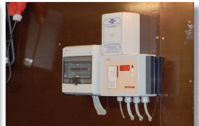
Enkel klimastyring af varme og ventilation, der sikrer meget varme i begyndelsen - 28 til 30 grader - faldende til 20 grader over en 4-ugers periode.