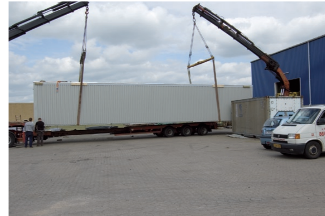
En komplet stald er på vej.