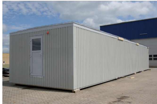
Pavillonen bygges helt færdig på fabrikken.