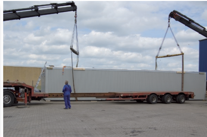
Den færdige pavillon løftes på plads på blokvogn.