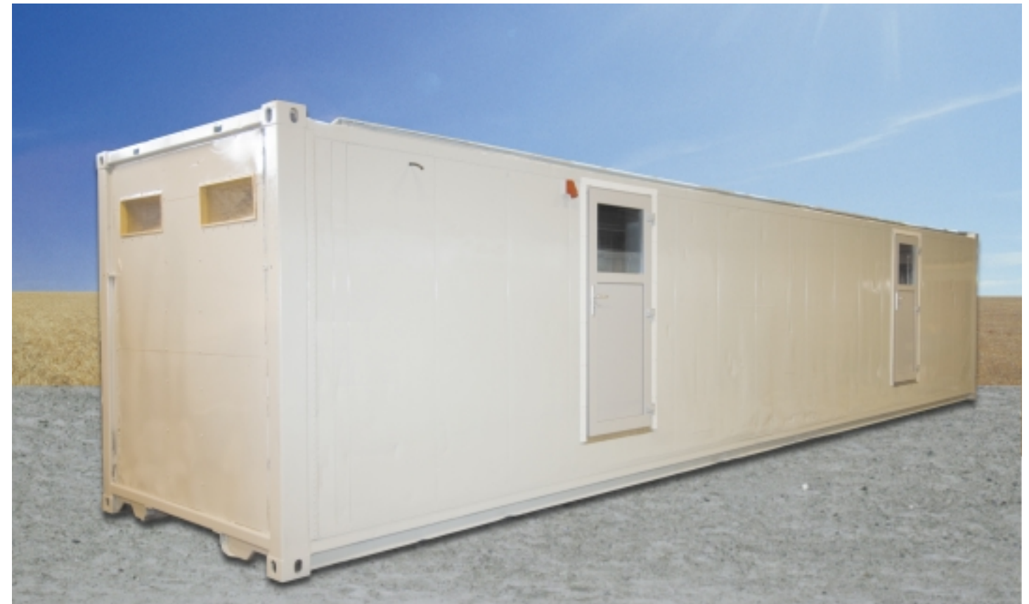
12 x 2,5 m. model med plads til 130 grise.